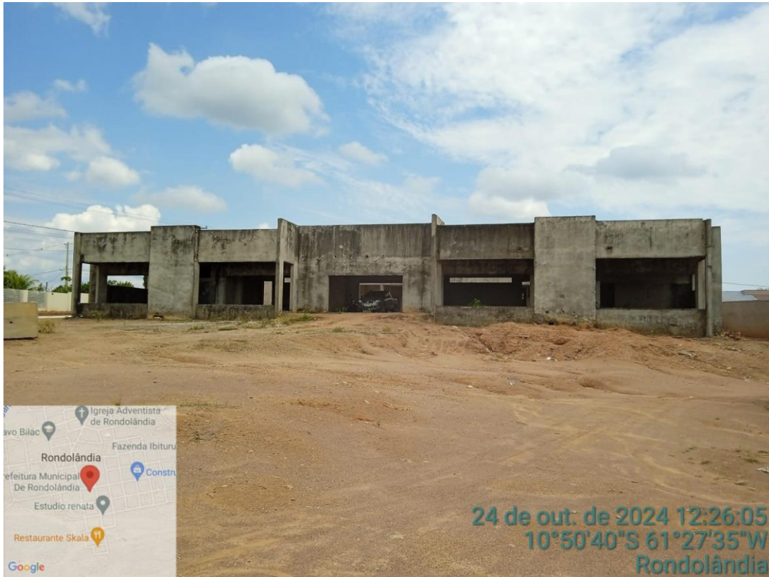
IMAGEM DOS FUNDOS DA CRECHE.